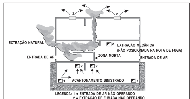
Figura 2: Zonas mortas